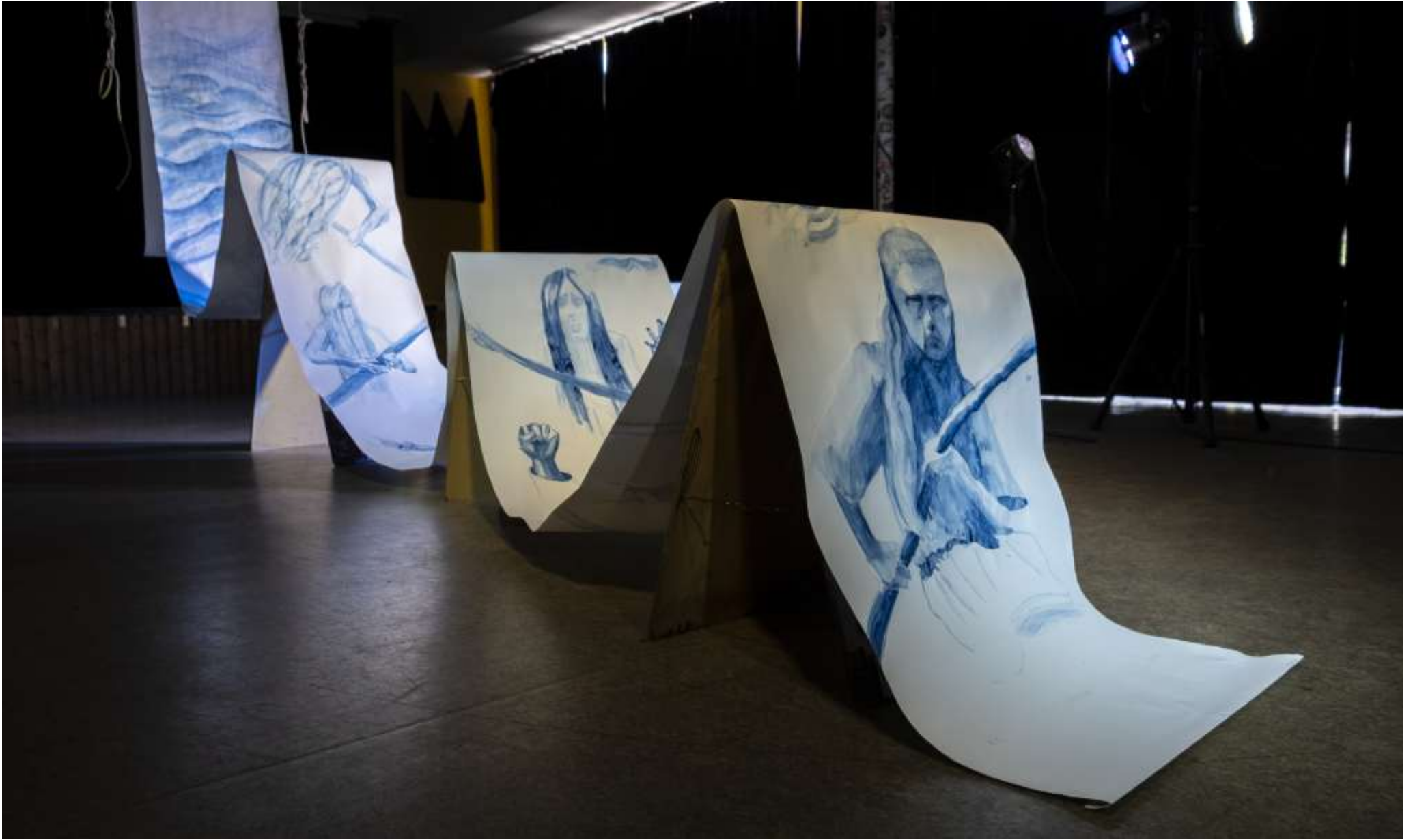
Ursinae, 2025 installerat framför scenen på Kulturhuset Kungen. Akvarell på papper, berlinblå (eller preussiskt blå) pigment, DIY gjorda gatupratare i trä, rundstav och rep (hampa) Mått: 1000 x 62 cm