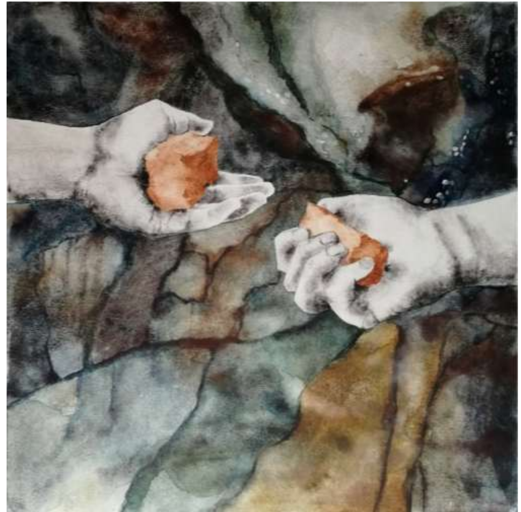
Ta, 2023, akvarell, järnbaserade pigment på papper, 40 x 40 cm. Inköpt av Region Västmanland 2024.

Händers rörelser och gester utforskas som grund för större ingrepp i landskapet. Teknik och maskiner redovisas inte för att göra intention och kroppens deltagande mer synligt. Bakgrundens färger utgår från besök i gruvan i Taberg, Småland (TV). Färger utgår från besök i gruvan i Bastnäs, Västmanland (TH). Att peka är att vilja ha. Verken behandlar övergången mellan att hitta en sten, att hålla den i handen och sedan välja att behålla den. Ett ögonblick där "se" blir "ha" blir "ta".