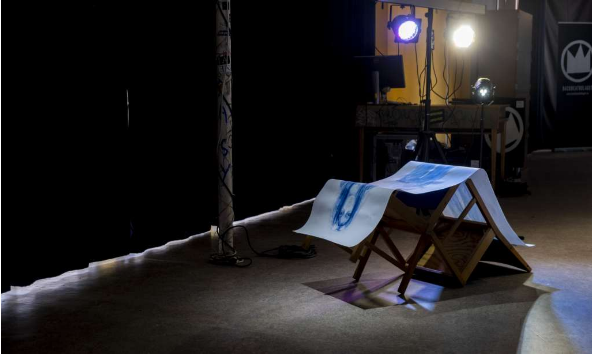
Talande tystnad, 2025, akvarell på papper, (Berlin/Preussiskt blå), vilar på två stolar från källaren på Kulturhuset Kungen. Mått:168 x 58 cm