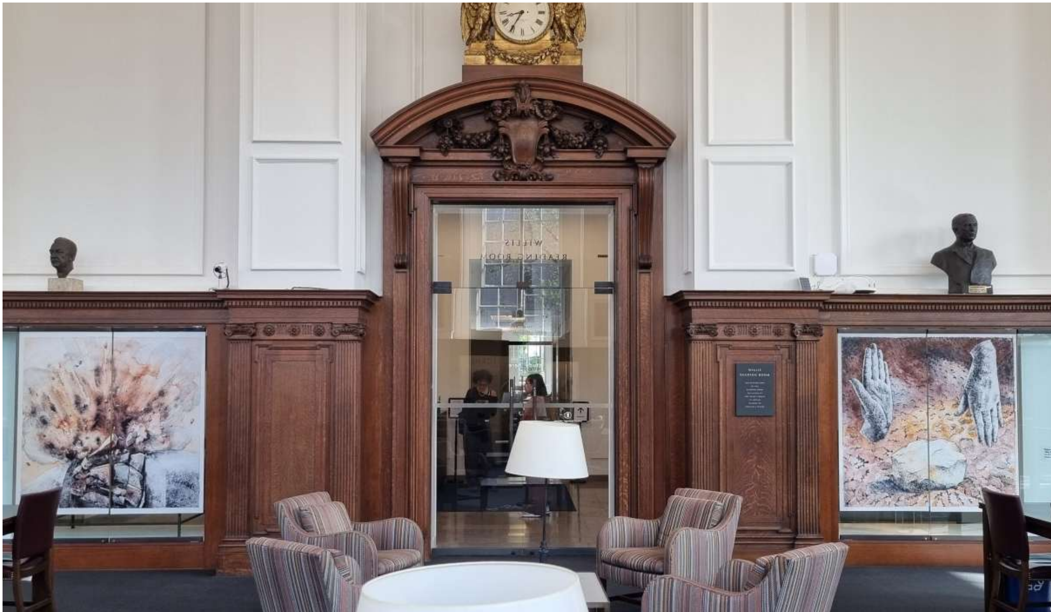
Täkt [Quarry] och Takt [Beat], 2025. Fotograferade, förstörade och printade på vinyl som installerats på glas i utställningen Shared Magma, Providence, RI, USA.