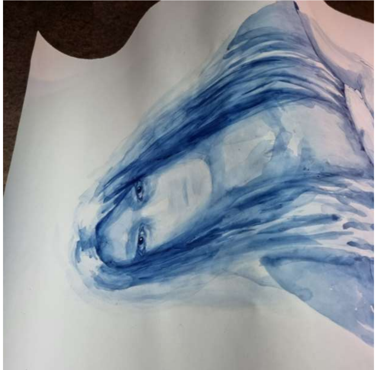
Talande tystnad, 2025, akvarell på papper, (Berlin/Preussiskt blå). Mått:168 x 58 cm. Detalj

Verket "Talande tystnad" härstamma från arbetet som mentor för unga vuxna i Sandviken och skapar en linje till den unga kvinnan Sveas blick fotograferad 1925. 100 år senare möts jag av en liknande blick, tyst och rak och upp till oss att förstå och tolka.