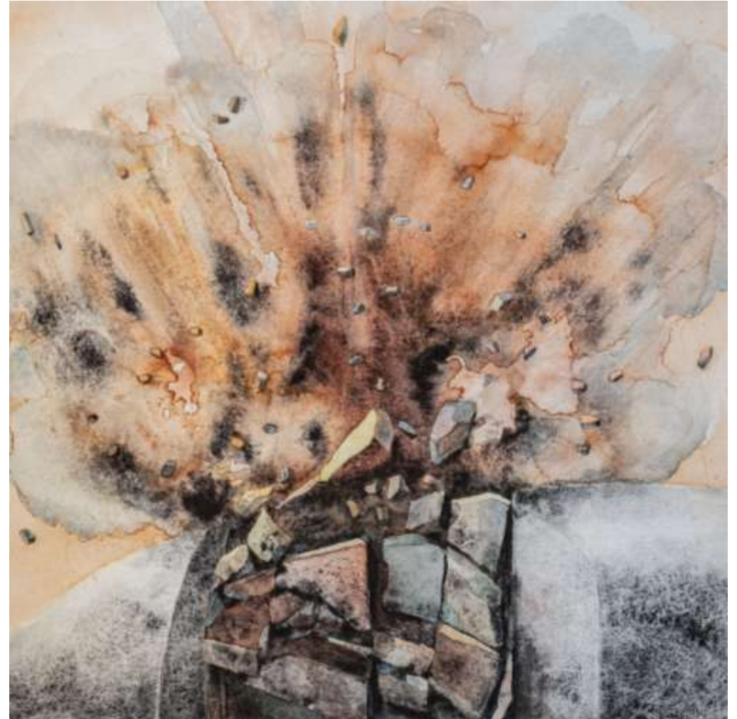
Täkt [Quarry], 2024, akvarell, järnbaserade pigment på papper, 40 x 40cm. Ordet täkt är en äldre böjningform av "att ta" och återfinns i ordet "våldtäkt".