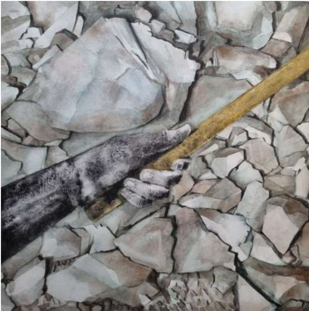
Ha, 2024, akvarell, järnbaserade pigment på papper, 40 x 40 cm. Del i utställningen Huggen.