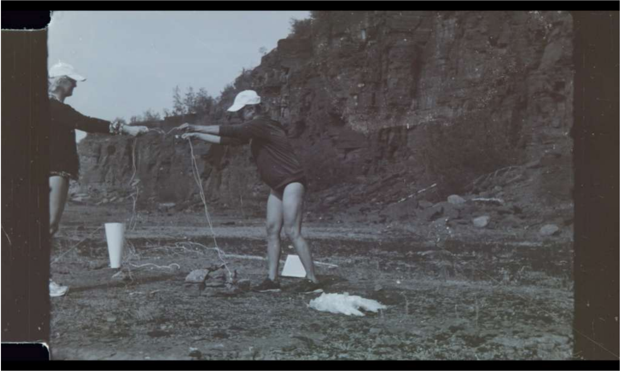
Ritual, 2022, experimentell dokumentärfilm, 55:00 min.