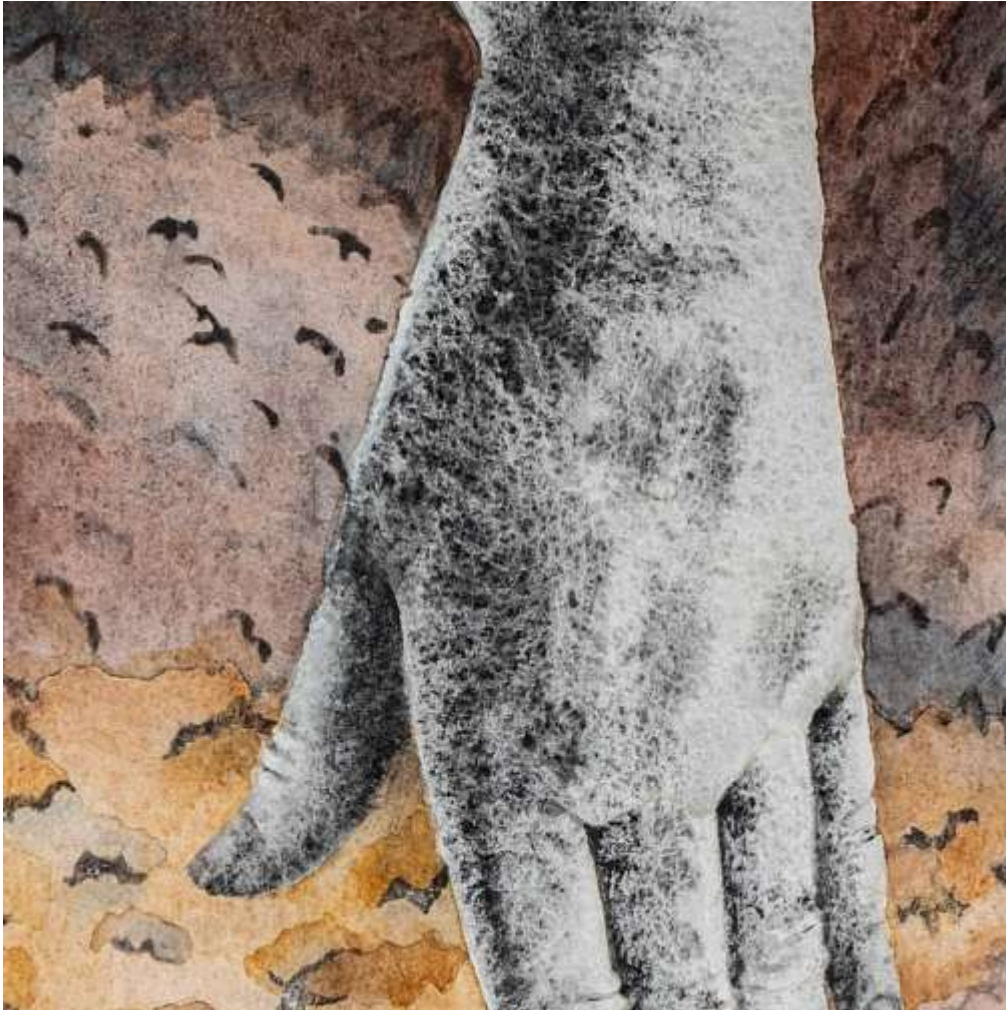
Takt [Beat], 2024, akvarell, järnbaserade pigment på papper, 40 x 40 cm. Detalj