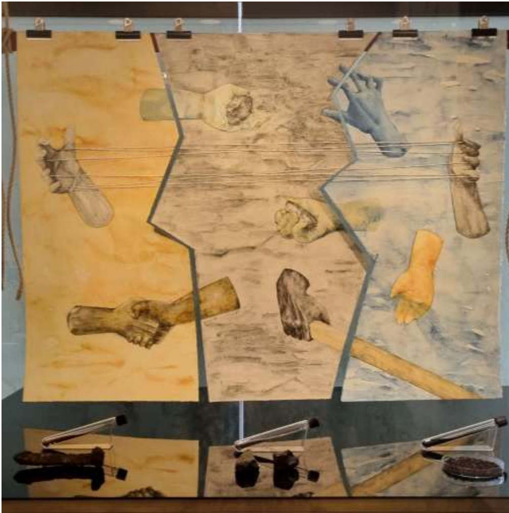
Sprickorna och vaggan [The Cracks and the Cradle], 2025, del i utställningen Shared Magma. Akvarell, järnbaserade pigment på papper, järn (inorganiskt och organiskt), rep av hampa, trä målat med med falurödfärg. 76x100 cm (målning).